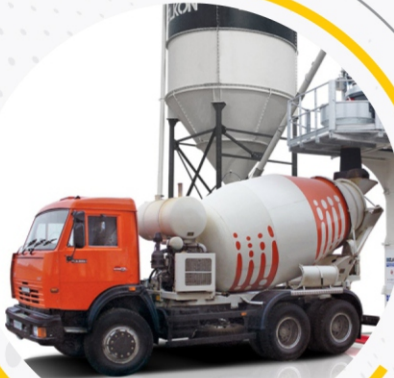
محطة خرسانة جاهزة